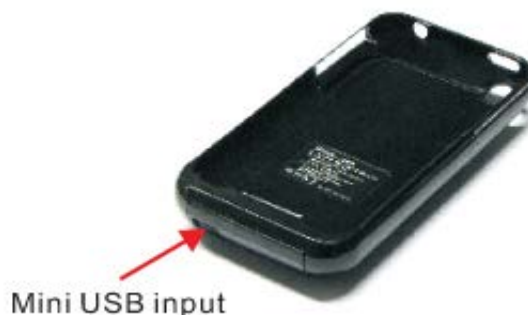
Рис. Mini USB input – разъем miniUSB

Разъем miniUSB: используется для зарядки аккумулятора зарядного чехла. USB-кабель входит в комплект поставки.