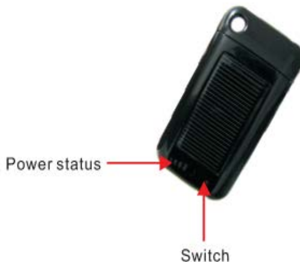
Рис. Power status – состояние питания Switch – кнопочный переключатель

Рекомендуемое время зарядки аккумулятора для первых нескольких циклов разряда/заряда – минимум 10 часов.